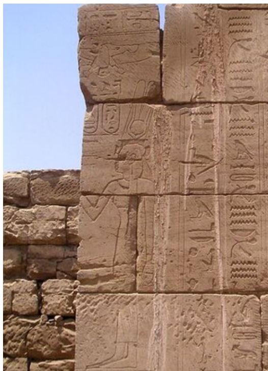
La divine adoratrice Nitocris Ire - Relief de la chapelle quelle fit édifier à Karnak

grande adopta la « fille » Ankhnes-néferibrê. Elle lui révéla les secrets de la fonction, lui apprit à gouverner et mourut en l'an 4 du Pharaon Apriès, en 585, au terme de quelques années de règne commun avec la onzième Divine Adoratrice.