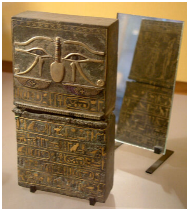
Coffret en bronze au nom de Chepenoupet II conservé au Musée du Louvre