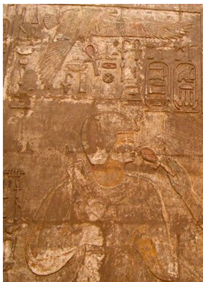
Relief représentant la divine adoratrice Amenirdis Ire - Temple d'Osiris Heka-Djet à Karnak

Fille du roi éthiopien Kachta, Aménirdis, dont le nom était suivi de l'épithète « la perfection de Mout est rayonnante », eut un long règne. C'est à Karnak , en 1858, que Mariette découvrit une statuette la représentant sur les genoux du dieu Amon , dans un état d'abandon amoureux qui illustrait l'union métaphysique avec Je principe créateur. Cette Divine Adoratrice laissa des traces de son activité architecturale sur le site de Karnak et à Médinet Habou , où sa très belle chapelle est pourvue d'une remarquable voûte de pierre. De nombreuses scènes rituelles ornent les murs. La chapelle avait reçu un abondant matériel funéraire, notamment une table d'offrandes et des statues d' Osiris au nom d'Aménirdis. Elle participa à des rites de fondation et dirigea une cour placée sous la responsabilité d'un grand intendant nommé Harwa. C'est d'ailleurs ce dernier qui, en tant que prêtre d'Anubis, organisa les funérailles d'Aménirdis l'ancienne son culte funéraire. Grâce à Mariette, librettiste d'opéra pour un temps, la mémoire de cette Divine Adoratrice survécut, quoique déformée, dans Aïda , l'opéra de Verdi.