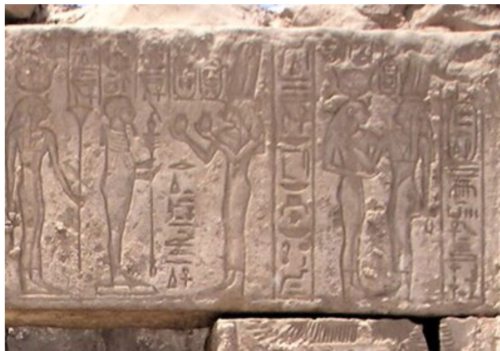
Relief représentant les divines adoratrices Chepenoupet II et Amenirdis II