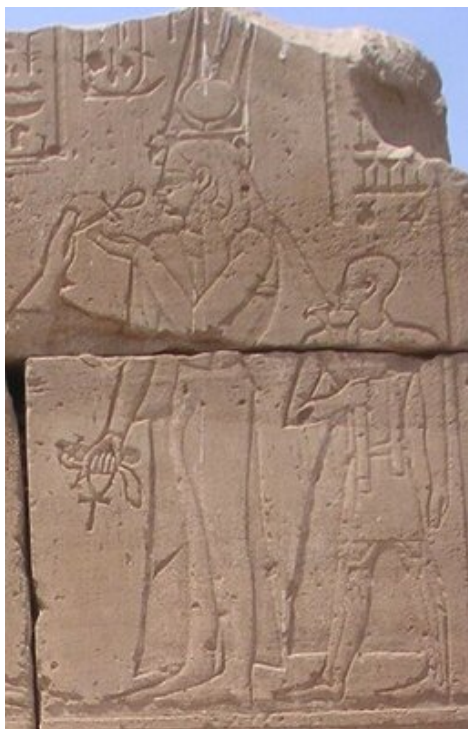
La divine adoratrice Ânkhnesnéferibrê - Relief provenant de la chapelle qu'elle fit édifier à Karnak

bonheur, échappa à la destruction ; l'expédition française de 1832 le retrouva, mais les pouvoirs publics ne le jugèrent pas assez intéressant pour l'acheter. Plus perspicaces, les Anglais s'emparèrent de ce chef-d'œuvre, aujourd'hui exposé au British Museum. Il est couvert de textes d'une importance capitale qui retracent la destinée spirituelle de la Divine Adoratrice. Quel sort les barbares perses réservèrent-ils à la dernière Divine Adoratrice ? Nous l'ignorons.