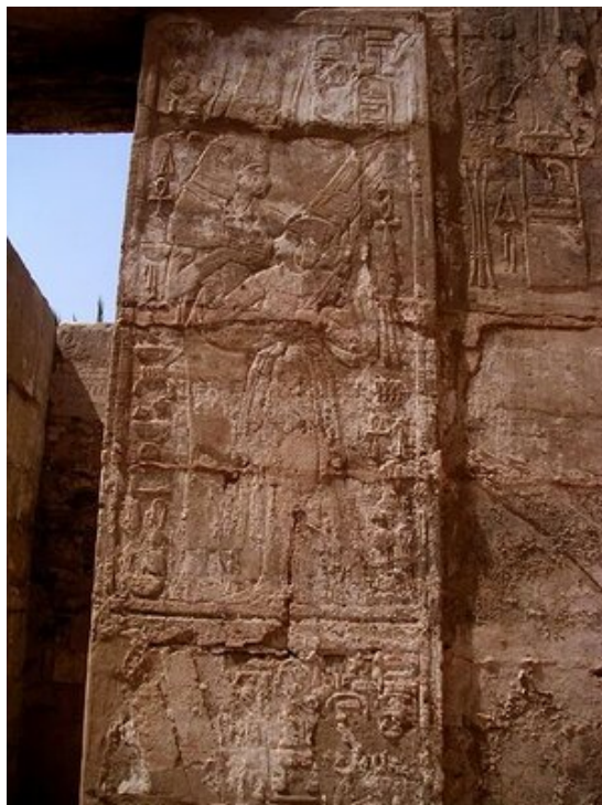
Relief représentant la déesse Hathor-Sothis allaitant la divine adoratrice Chepenoupet Ire

magnificence, et préserva l'institution sacrée des Divines Adoratrices.