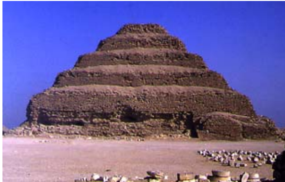
La pyramide à degrés du pharaon Djoser

Grand dieu égyptien d' Héliopolis , le Soleil bénéficia d'une faveur grandissante au cours de l' Ancien Empire , ainsi qu'en témoignent les noms et les titulatures des rois de cette période : de plus en plus, les souverains prennent l'habitude de se donner des noms composés avec celui de Rê et le titre de « fils de Rê » est inclus dans les titulatures royales dès la IV e dynastie, fondée par Snéfrou en 2720 environ. Le roi, sous l' Ancien Empire , est le seul à ressusciter sous la forme d'une divinité. Il a également le pouvoir de se joindre au dieu Rê dans sa barque. Les pyramides sont construites selon cette conception : elles sont à la fois la colline primordiale sur laquelle Rê accomplit la création et la symbolisation des rayons du soleil, ainsi que l'escalier qui monte au ciel.