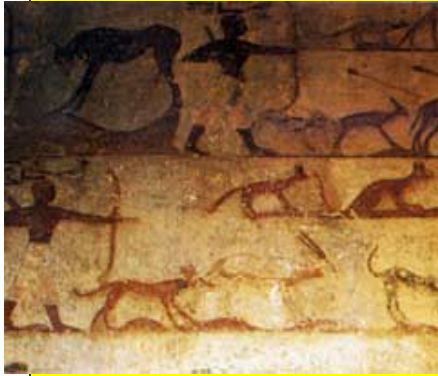
Scène de chasse sur le mur sud