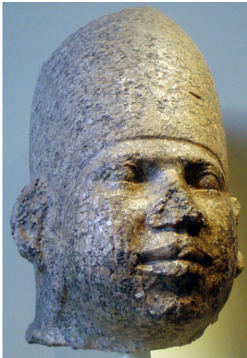
Tête en granite du pharaon Houni Brooklyn Museum

Sous le règne du roi Djôser, des textes mentionnent déjà la présence d'un certain Houni à la Cour royale, bien qu'il ne soit pas établi qu'il s'agisse du même personnage. Le papyrus de Turin lui confère un règne d'une durée de 24 ans, au cours duquel il fit construire une forteresse sur l'île d' éléphantine afin d'assurer la sécurité de la frontière méridionale. On lui doit la construction de la plupart des pyramides dites « provinciales », monuments probablement élevés pour le culte solaire qui prenait son essor à cette époque. La pyramide de Meidoum lui est parfois attribué, sans pour autant que cela soit avéré, car son nom ne figure nulle part sur le site.