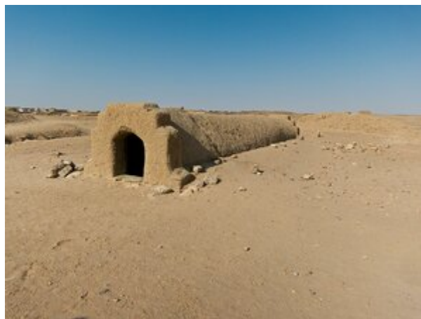
Extérieur de la tombe, sur le site d'El-Kourrou

Tanoutamon est enterré dans la nécropole royale d'El-Kourrou sous la pyramide « KU 16 ». Le tombeau de Tantamani était situé sous une pyramide, aujourd'hui disparue, sur le site d'El-Kourrou. Il n'en reste que l'entrée et les chambres, magnifiquement décorées de peintures murales.