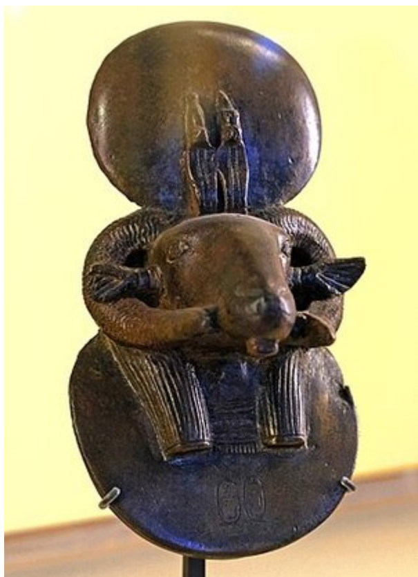
Tête d'Amon bélier inscrite au nom du roi Tanoutamon (25e dynastie)

Tanoutamon est le dernier pharaon de la XXVe dynastie, couronné dans le temple d'Amon du Gebel Barkal. Il est Napata et Pharaon de -664 à -656. Manéthon l'appelle Tanoutamon.