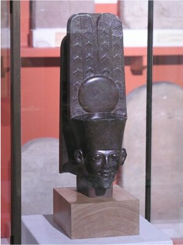
Tête d'une statue du dieu Amon dédiée par Tanoutamon

Il reprend la lutte pour concrétiser le rêve de son père et s'engage immédiatement dans une campagne militaire contre les souverains rebelles du Nord, dont le roi de Saïs Nécho Ier mis en place par les Assyriens. Il assiège et prend Memphis et Nécho Ier meurt au cours de la bataille.