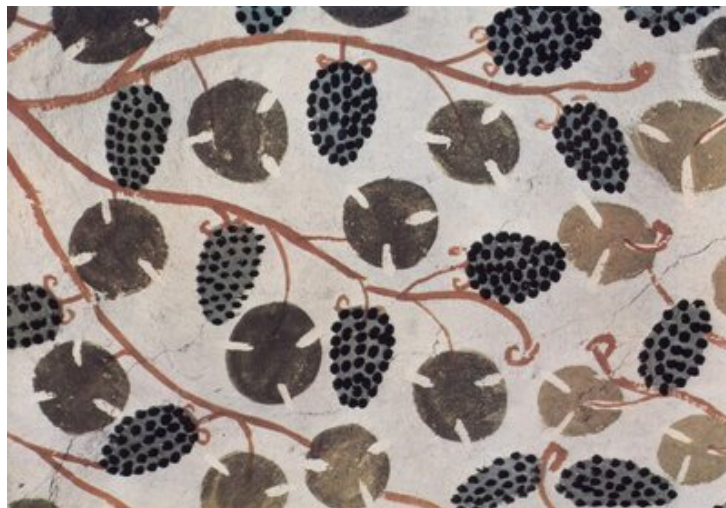
Détail de la décoration de la tombe

Elle a toujours fasciné les visiteurs pour son plafond, qui reproduit le réalisme des couleurs éclatantes avec une grande pergola, d'où son surnom.