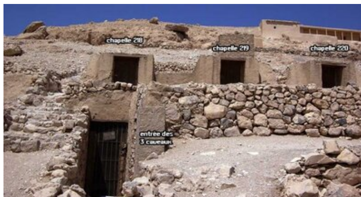
Vue de l'entrée

C'est la sépulture d'Amennakht, artisan du village de Deir el-Médineh durant l'époque ramesside, est intégrée dans un complexe funéraire familial où Amennakht, son fils Nebenmaât et son petit-fils Khaemter disposent de trois caveaux bénéficiant de parties communes et de trois chapelles de surface contiguës (Tombes thébaines 218, 219 et 220). Elle fut découverte en 1928 par l'égyptologue français Bernard Bruyère (1879-1971).