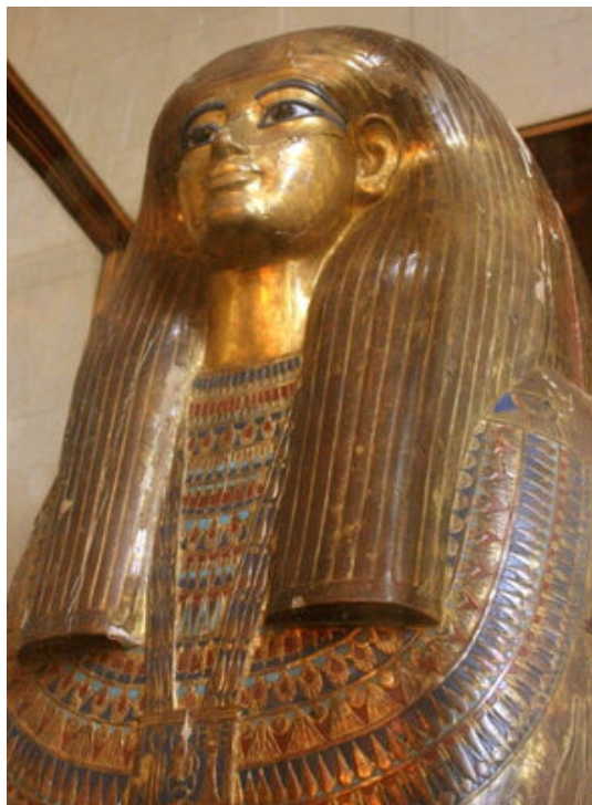
Troisième sarcophage intérieur de Youya