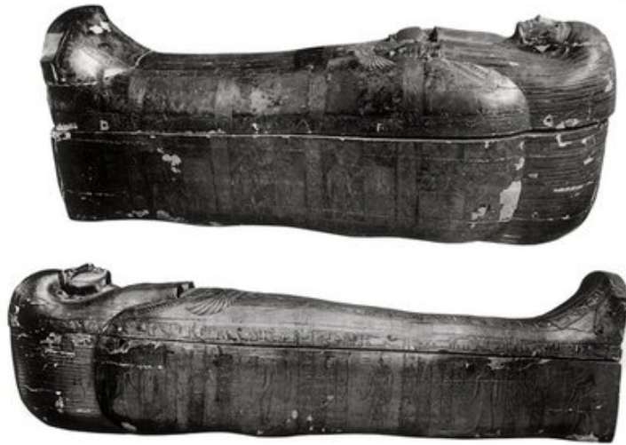
1er et 2em Sarcophage intérieur de Youya

Situé dans la vallée des rois, dans la nécropole thébaine sur la rive ouest du Nil face à Louxor en Égypte, KV 46 est le tombeau du couple Youya et Touya.