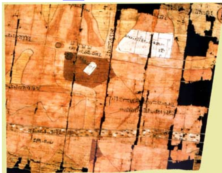
Carte des mines d'or et des carrières, XXe dynastie

Les mines étaient monopoles d'Etat. Les divers gisements étaient sous la responsabilité d'un personnage de haut rang, le « directeur des exploitations ». Les mines d'or, elles, étaient placées sous la responsabilité du clergé d' Amon à Karnak et du « Grand des Gebels de l'or d' Amon ».