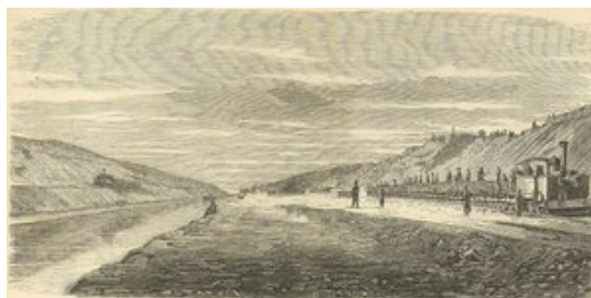
la construction du canal

Après la guerre des Six Jours de 1967, le canal resta fermé jusqu'en 1975, une force de maintien de la paix de l'ONU restant sur place jusqu'en 1974.