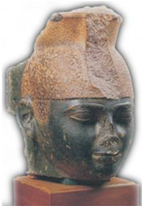
Buste de Taharqa

Taharqa , roi d'Égypte, se réfugie alors plus au sud. L'Assyrie apporte son soutien aux Saïtes, rivaux de l'Égypte, qui agitent le nord de la vallée du Nil . En 669, l'Égypte sème à son tour le trouble dans le nord, ce qui oblige Assarhaddon à intervenir de nouveau. Mais le roi meurt en chemin et le pouvoir revient à ses deux fils : Assurbanipal monte sur le trône à Ninive et Shamash-shum-ukîn à Babylone. Le premier envoie en Égypte un corps expéditionnaire qui écrase Taharqa à Memphis . Le descendant lointain des pharaons s'enfuit à Thèbes , mais l'Assyrien est décidé à le poursuivre. Soumettant la Haute-Égypte, il ne parvient pourtant pas à le rattraper.