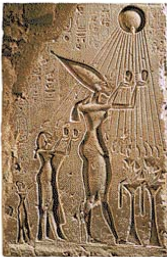
▲ RELIEF ÉGYPTIEN RÉPRÉSENTANT AKHENATON ET NÉFERTITI

Aussitôt, le parti d' Amon redressa la tête ; même les courtisans les plus zélés du pouvoir amarnien, virent dans la disparition d' Akhénaton le signe du retour à l'orthodoxie, incarnée par le clergé de Karnak . La religion amarnienne ayant fait table rase des croyances panthéistes, apparaissait comme un artifice intellectuel niant plusieurs millénaires de théologie. Prenant les opinions de l'élite à rebours, elle n'était pas parvenue à s'encrever dans l'inconscient collectif, même si elle imprégna ceux qui, issus des classes moyennes, avaient cru au rêve amarnien, derrière un souverain ayant porté au rang de dieu d'État un dieu faisant l'objet d'une dévotion personnelle. Cependant, même les ouvriers de Tell el-Amarna conservaient discrètement des images des dieux proscrits.