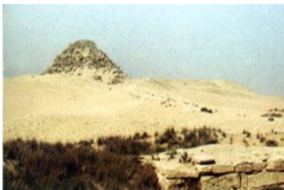
La pyramide de Sahouré

L'origine du mot de pyramide est encore discutée entre les partisans d'une racine égyptienne hellénisée et ceux d'une origine purement grecque. Alors que dans les textes égyptiens la pyramide est toujours désignée par le vocable mer , Hérodote emploiera le mot puramiv , qui désignait aussi un gâteau de miel et de farine. Néanmoins, comme on trouve ce mot appliqué peu après à la figure géométrique matérialisée par ces tombeaux, il semble plausible que les mathématiciens grecs, qui, tel Pythagore, s'étaient rendus en Égypte dès avant Hérodote, aient retenu pour nommer aussi bien ces édifices que leur figure géométrique un terme revenant fréquemment lorsqu'il en était question ; Maspero avait ainsi songé à celui de pr-m-ous , utilisé par les géomètres égyptiens pour désigner l'une des lignes déterminantes de la pyramide.