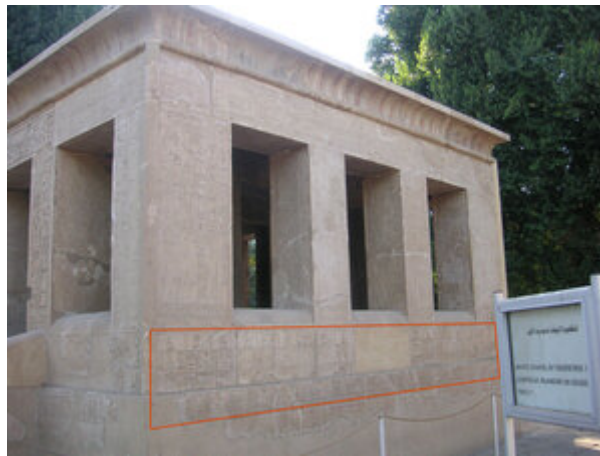
Liste des nomes sur le mur de la Chapelle Blanche de Sésostri Ier.

Chaque nome a sa métropole, centre administratif et judiciaire, un ou plusieurs sanctuaires, et son emblème totémique : faucon, crocodile, cobra, gazelle, sycomore, couteau, etc. Cette division de l'Égypte semble remonter à la période prédynastique, où les nomes étaient des territoires tribaux ou claniques autonomes, avant de devenir, sous les premières dynasties, des divisions territoriales administrées par un fonctionnaire.